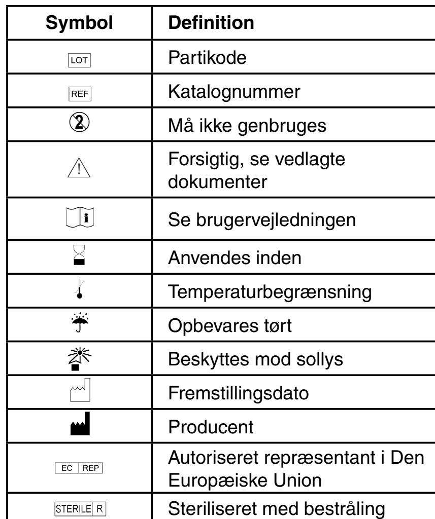
Tabel 1. Definitioner på symboler og forkortelser

Der kan være anvendt symboler og forkortelser på pakkens etiket. Følgende tabel indeholder definitioner på disse symboler og forkortelser.