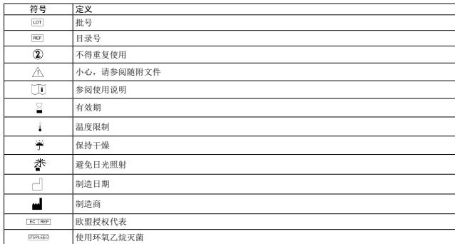
表1符号和缩写的定义